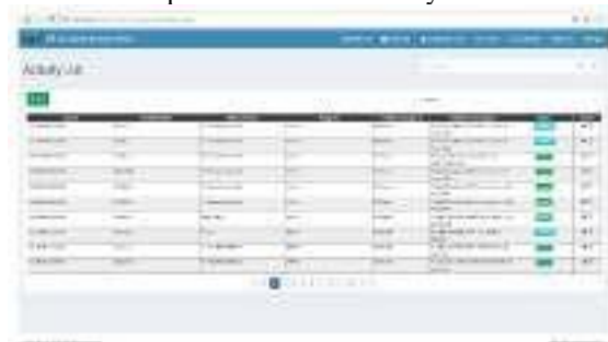
Gambar 4. Halaman Activity List