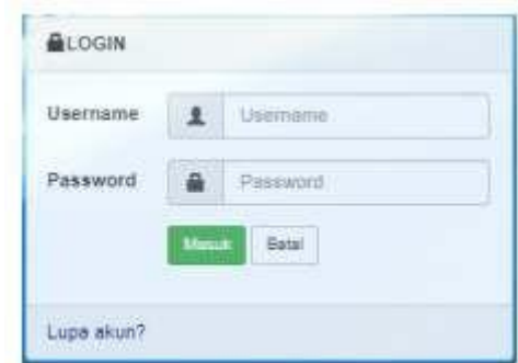
Gambar 3. Halaman Login