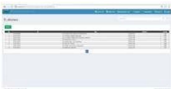
Gambar 7 Halaman Guidance