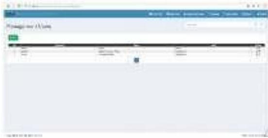
Gambar 6 Halaman Management User