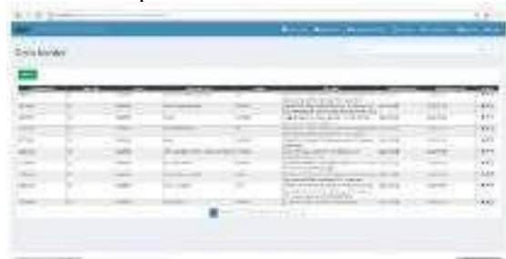
Gambar 5. Halaman Master Data