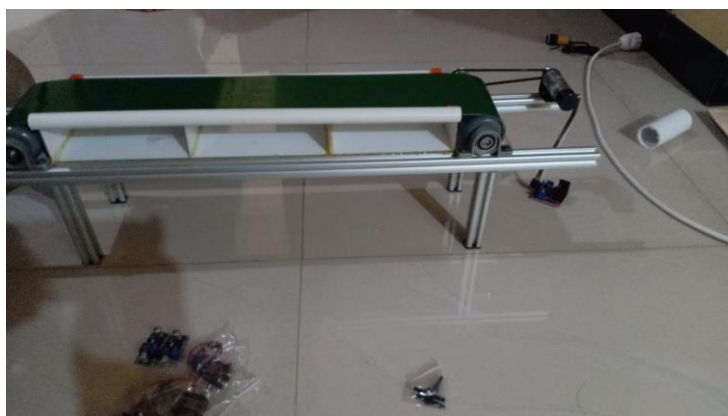
Gambar 2. Rangkaian Alat Pengujian

Rancangan rangkaian alat pengujian untuk mendukung penelitian ini diperlihatkan dalam Gambar 2 berikut: