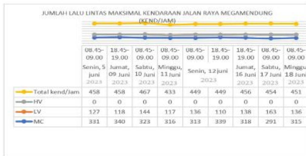
Gambar 3. Data Lalulintas Selama Sistem Satu Arah (SSA)

Berdasarkan hasil survei yang telah dilakukan didapatkan data volume lalu lintas rata-rata selama SSA, sebesar 450 kendaraan, dapat dilihat pada gambar sebagai berikut :