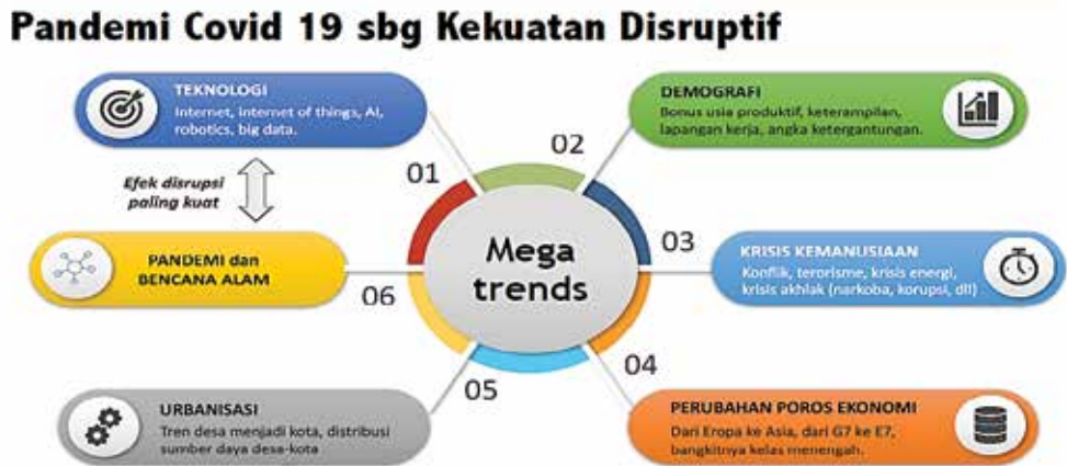
Gambar 1. Megatrends Disruption Effect