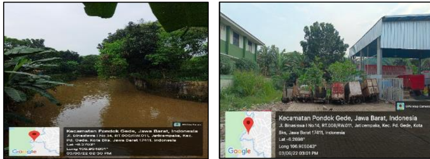
Gambar 3. Lokasi wilayah RW 11 dan Lokasi pinggiran bantaran sungai