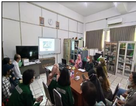
Gambar 1. Tim P2M FT UNKRIS

Tim pelaksana P2M terdiri atas tim Dosen dan Mahasiswa dari Prodi Teknik Perencanaan Wilayah dan Kota, Prodi Teknik Arsitektur, Prodi Teknik Sipil Fakultas Teknik Universitas Krisnadwipayana, yang terdiri atas 12 (dua belas) orang Dosen dan 15 (lima belas) orang mahasiswa, sedangkan dari pihak mitra kelurahan Jaticempaka dipimpin oleh Ketua RW 11 beserta tim pengelola TPST3R dengan para pengurusnya seperti pada gambar 1 yaitu tim sedang melakukan rapat koordinasi terkait pelaksanaan kegiatan dan gambar 2 yaitu tim melakukan kunjungan serta diskusi awal dengan mitra terkait dengan isu yang akan di bahas.