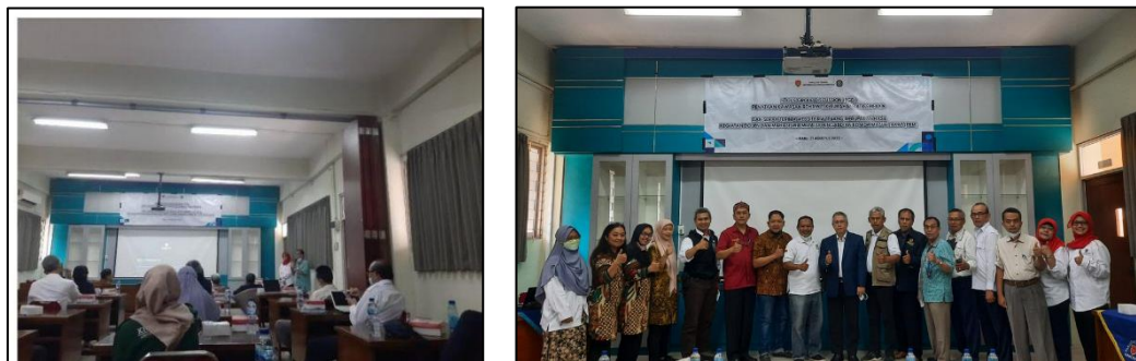
Gambar 6. Pelaksanaan FGD