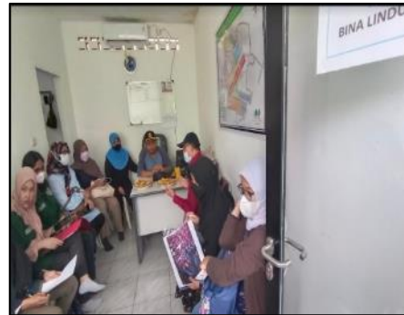
Gambar 2. Mitra Kelurahan Jaticempaka