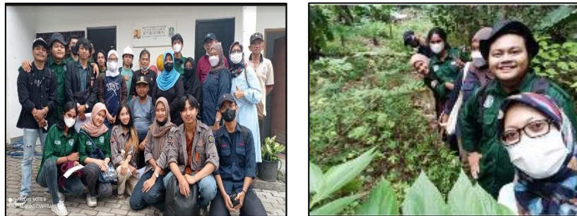
Gambar 4. Tim P2M Dosen dan Mahasiswa pada saat survei